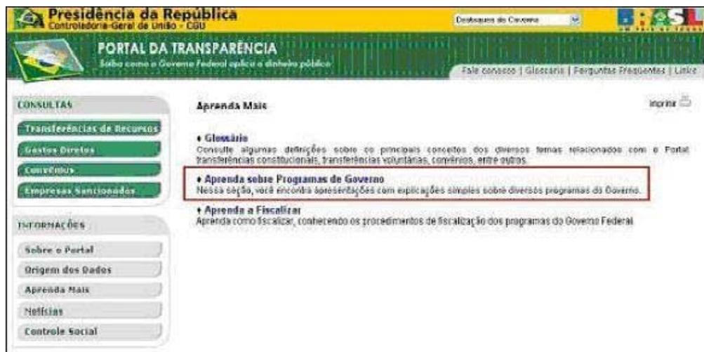
Figura IV – Aprenda Mais