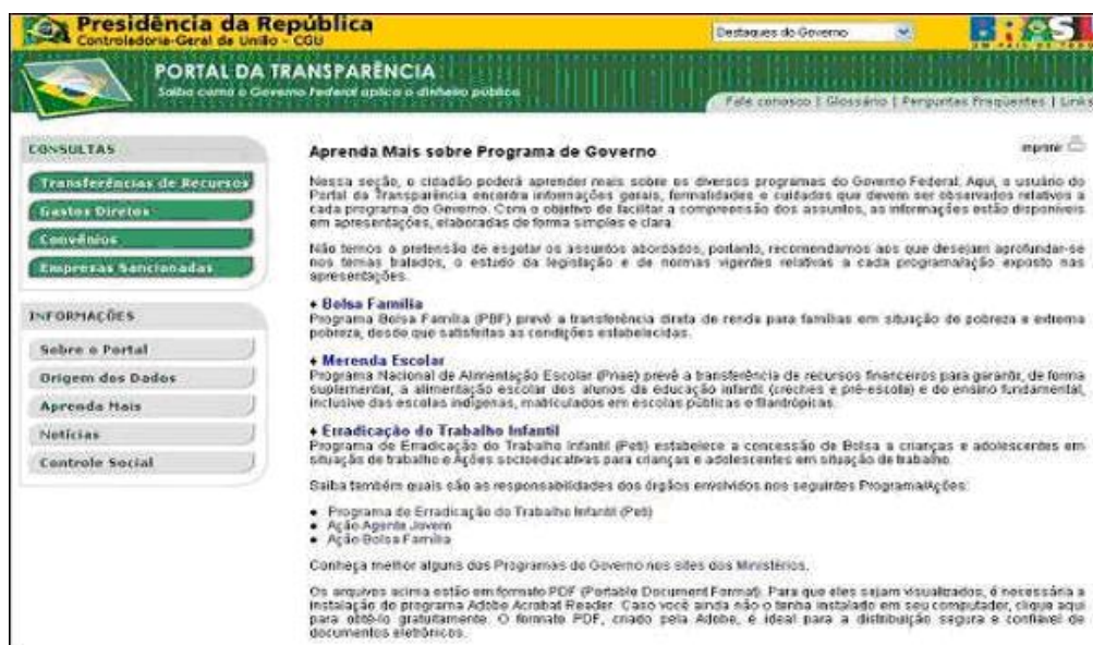
Figura V – Aprenda Mais Programas